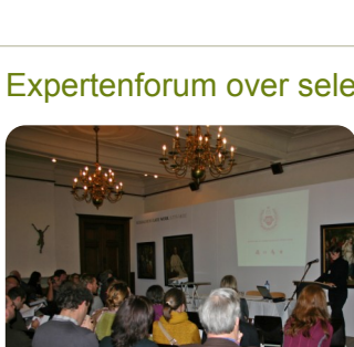
Expertenforum in de Abdij van Park