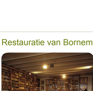
Erfgoedbibliotheek van de Sint- Bernardusabdij te Bornem