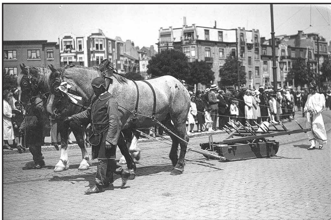
De processie van de Heilige Guido op Pinkstermaandag te Anderlecht, omstreeks 1930.

'Op handen gedragen' is een studie- en contactdag, zaterdag 10 oktober in Hasselt. De bijeenkomst is een initiatief van samenwerkende gespecialiseerde organisaties als LECA, CRKC en KADOC-KU Leuven. De dag is volledig gewijd aan processies en hun erfgoed. Iets voor belangstellenden die al in een erfgoedvereniging bezig zijn of voor zij die zich in dit onderwerp willen verdiepen.