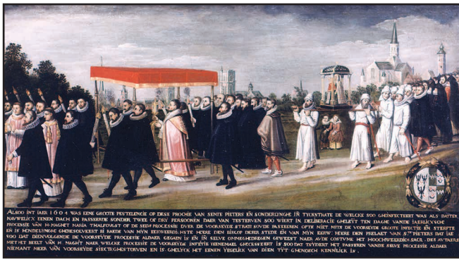
Een processie tegen de pest in 1604, op een schilderij van 1604, vervaardigd door een onbekende kunstschilder, met onderaan uitleg over de pestepidemie. Het olieverfdoek van 77 op 137 centimeter, wordt bewaard in de kerk van Onze-Lieve-Vrouw en Sint-Pieter aan het Sint-Pietersplein in Gent.